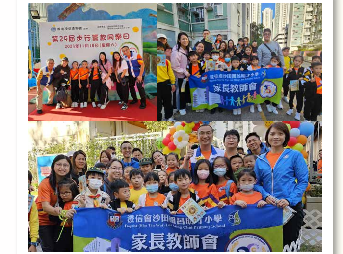
2023年11月18日 — 浸信會聯會步行籌款