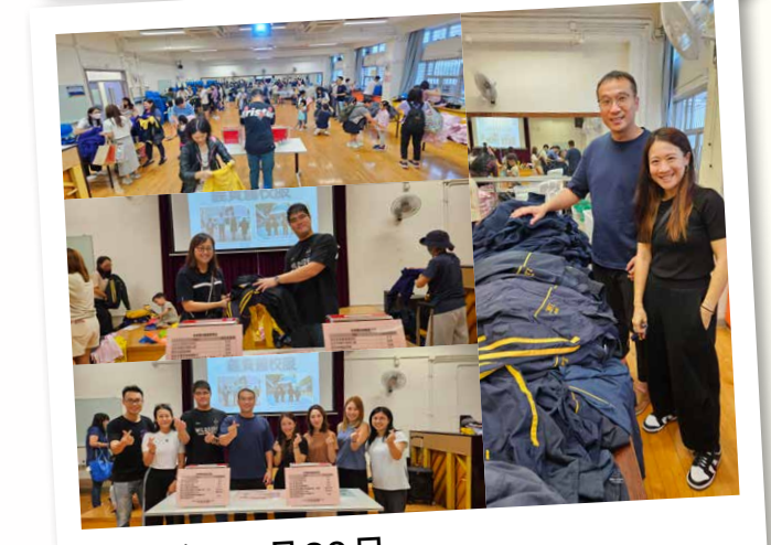
2023年10月28日 — 義賣冬季校服