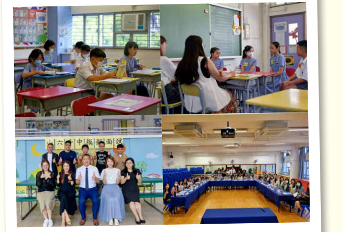
2023年11月4日 — 小六升中模擬面試