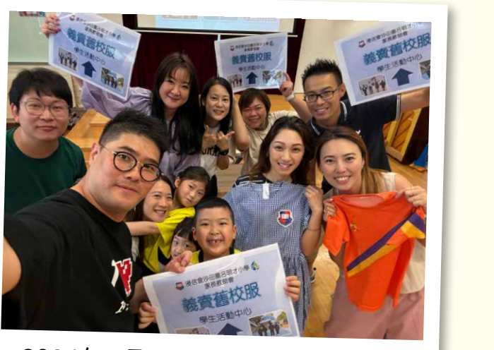
2024年4月20日 — 義賣夏季校服