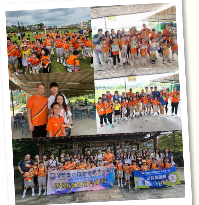
2024年5月11日 — 親子大旅行