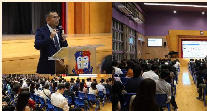
學校發展與課程重點簡介會暨班親會面晚會 2024/09/27