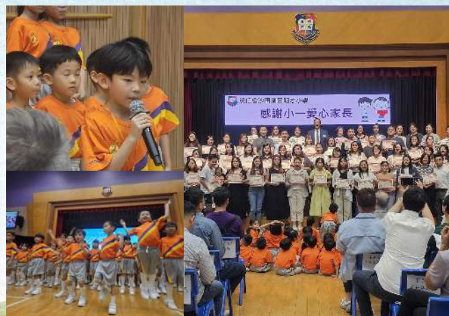
小一成長禮暨小一愛心家長重聚日 2024/10/04