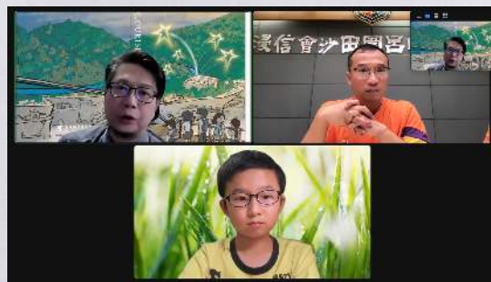
小五小六網上中學巡禮 2024/10/02