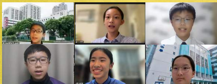
小五小六家長升中分享會 2024/10/10