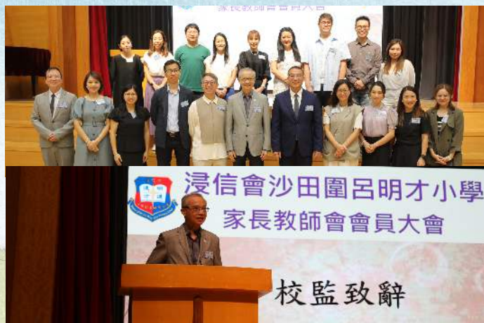
家教會就職典禮暨家長校董選舉晚會 2024/10/04