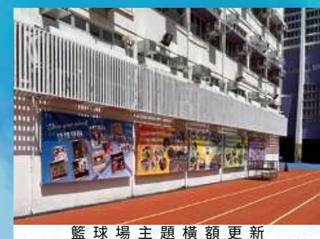
籃球場主題橫額更新