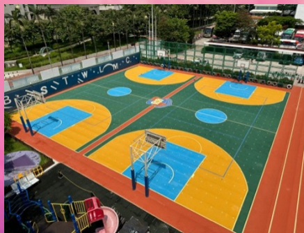
籃球場更換地膠工程