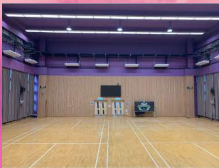
禮堂冷氣機更換工程