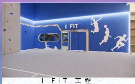
I FIT 工程