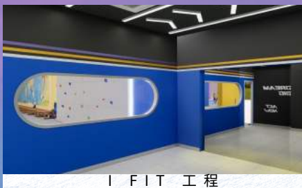
I FIT 工程