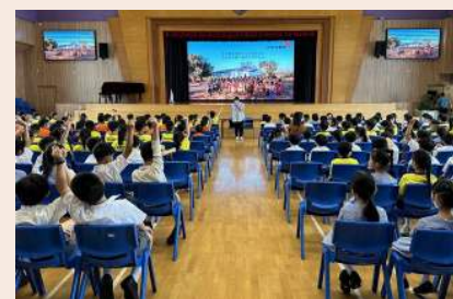
世界宣明會 「飢智FOOD BLOGGER」講座 2024-6-17