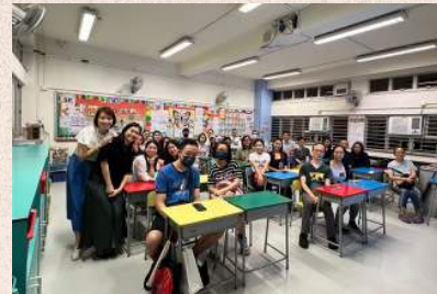
五年級「我們這一級」 2024-5-2