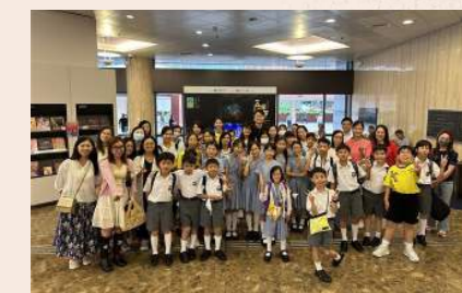
北京歌舞劇院舞劇「五星出東方」 公開綵排親子觀賞活動 2024-6-7