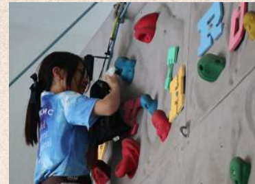
小六畢業活動一過六關攀石活動 2024-5-9